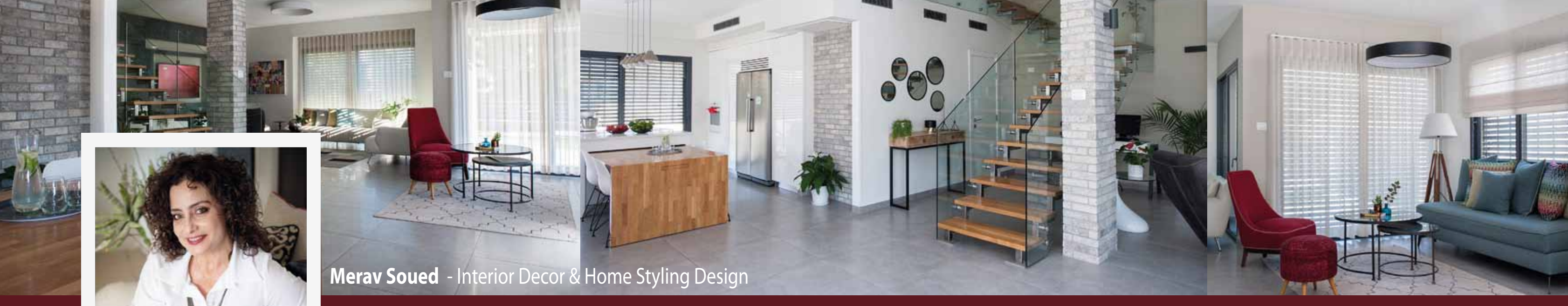
Merav Soued - Interior Decor & Home Styling Design